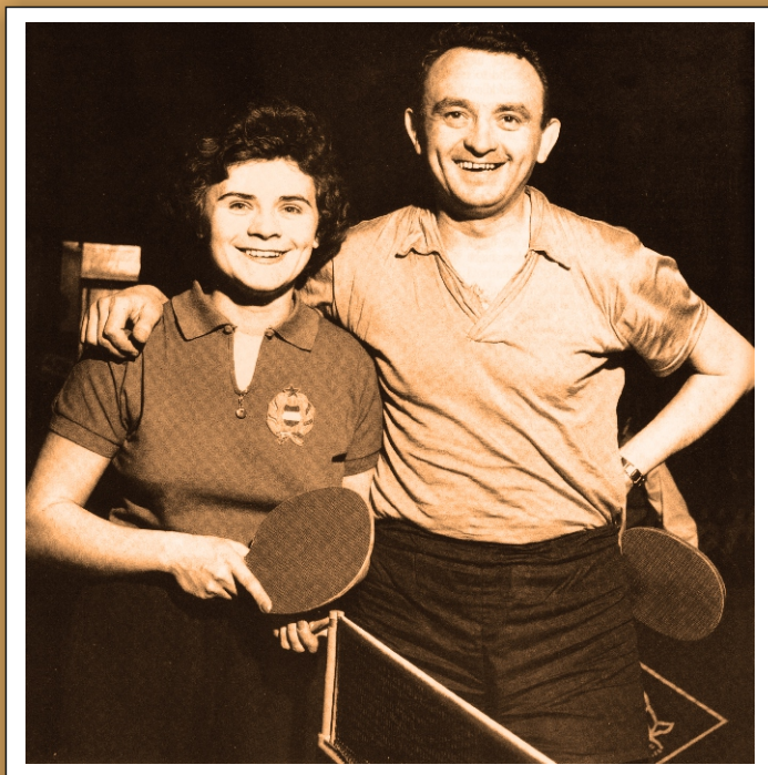
A híres Kóczián testvérek