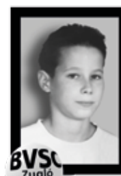
Molnár János Asztalitenisz Emlékverseny