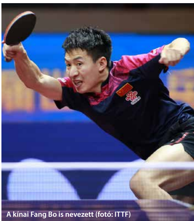
A kínai Fang Bo is nevezett

Aki pedig klasszis védőjátékost akar látni, annak a dél-koreai Dzsü Sze Hjuk ( Joo Sae-Hyuk ) vagy akár a legmagasabban rangsorolt magyar férfi játékos, Pattantyús Ádám jelenthet különleges csemegét. Az idősebb korosztály képviselői közül itt lesz a fehérorosz Vlagyimir Szamszonov, a szerb Alekszandar Karakasevics, sőt 45 évesen visszatér a csehek olimpiai negyedik helyezettje, Petr Korbel is.