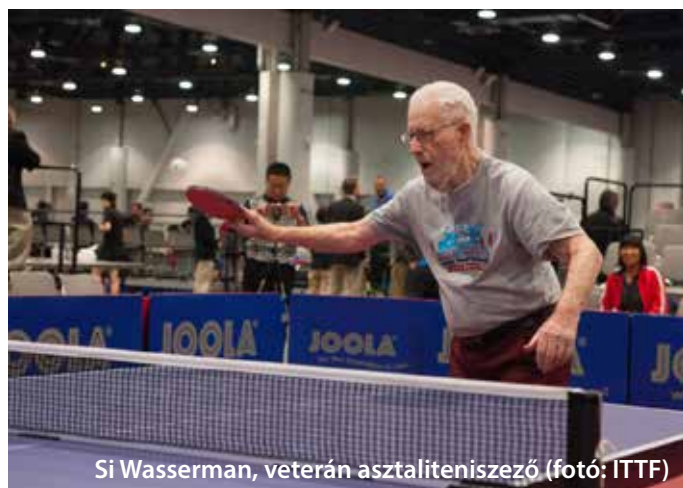
Si Wasserman, veterán asztaliteniszező