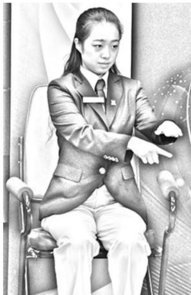
4 ábra Játékfelület alatt