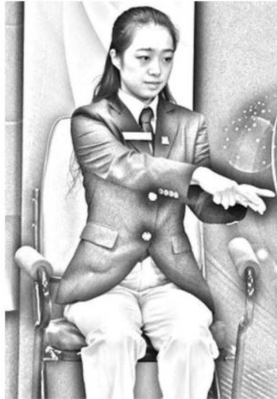
3 ábra: Labda az ujjakon fekszik

4. Ha a labda a játékfelület alá került, mielőtt megütötték volna, akkor a játékvezetőnek ill. az asszisztens játékvezetőnek a következőt kell tenni: