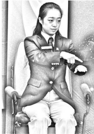
5 ábra: Alapvonalon belül

6. Ha a labda nem közel függőlegesen lett feldobva, akkor a játékvezetőnek ill. az asszisztens játékvezetőnek a következőt kell tenni: