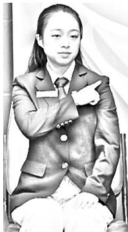
7(1) ábra: Vállal takarva