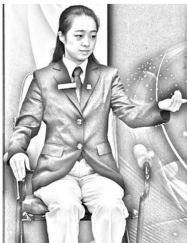
2 ábra: Nem nyitott tenyér