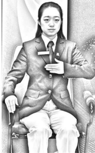
F7 ábra: takarva valami vagy valaki által

Ha a játékos kéri az okot is, akkor játékvezető további kézjelet használ, rámutat az ujjával, hogy mivel volt takarva a labda. Ha pl. a labda a fogadó elől az adogató vállával volt takarva, akkor a játékvezető a következőt teszi: